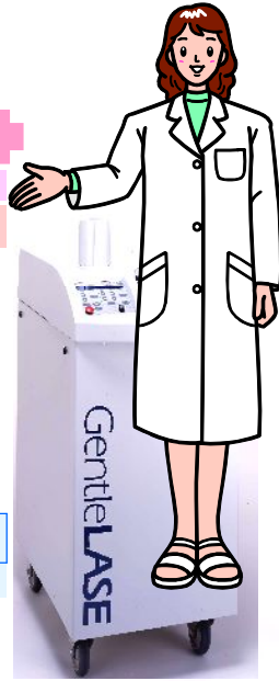
皮膚良性色素性疾患治療用レーザー装置